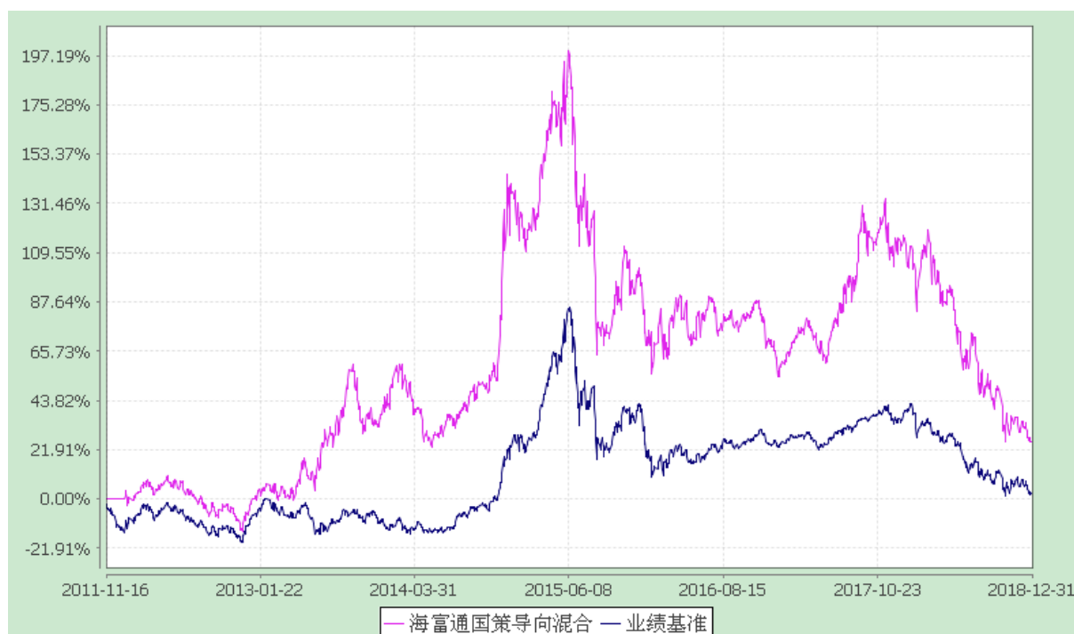
海富通国策导向混合型证券投资基金 份额累计净值增长率与业绩比较基准收益率的历史走势对比图 (2011 年 11 月 16 日至 2018 年 12 月 31 日)

注：按照本基金合同规定，本基金建仓期为基金合同生效之日起六个月。截至报告期末本基金的各项投资比例已达到基金合同第十四部分（二）投资范围、（七）投资限制中规定的各项比例。