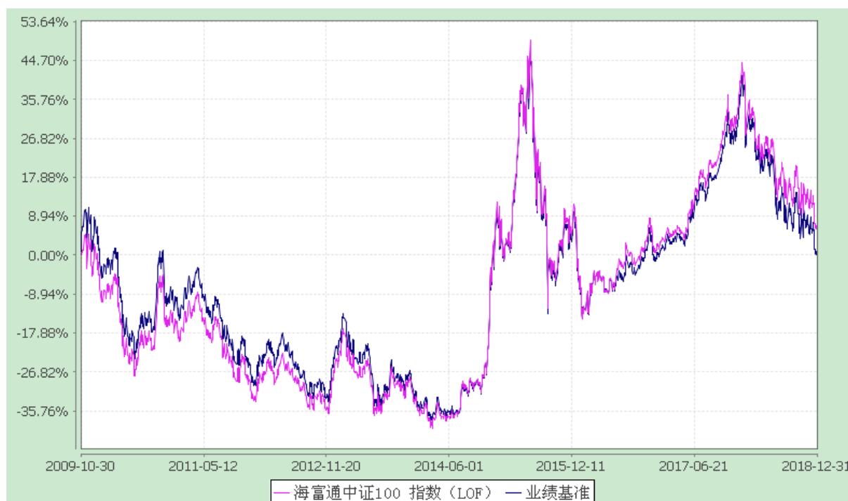
海富通中证 100 指数证券投资基金 (LOF) 份额累计净值增长率与业绩比较基准收益率的历史走势对比图 (2009 年 10 月 30 日至 2018 年 12 月 31 日)

注: 按照本基金合同规定, 本基金建仓期为基金合同生效之日起六个月。建仓期满至今, 本基金投资组合均达到本基金合同第十五条 (二)、(七) 规定的比例限制及本基金投资组合的比例范围。