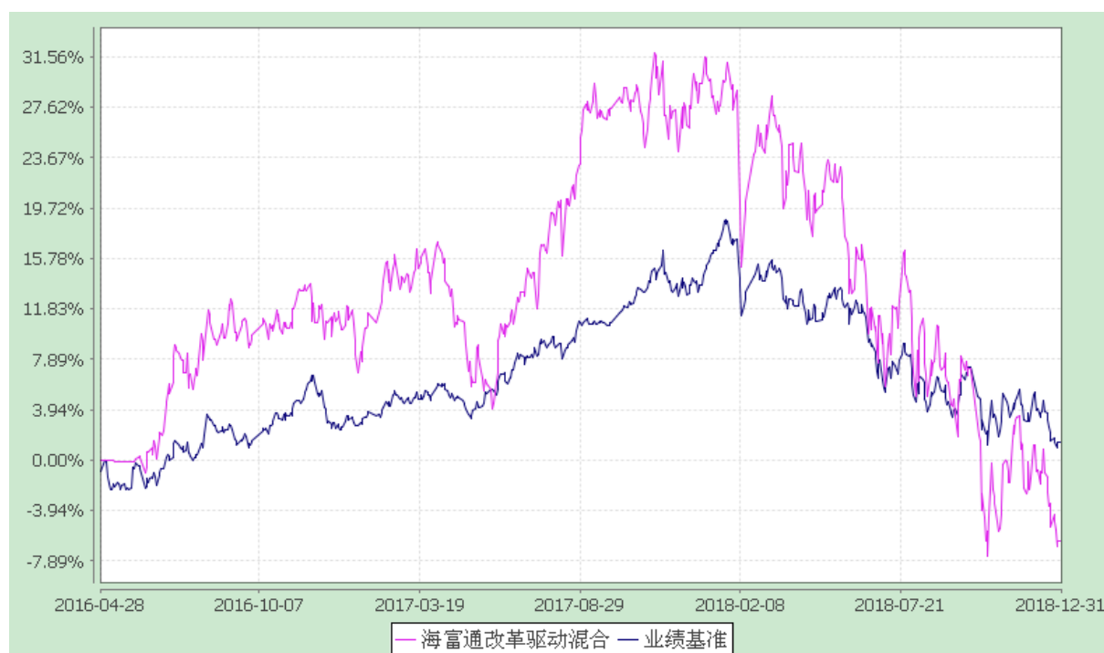
海富通改革驱动灵活配置混合型证券投资基金 份额累计净值增长率与业绩比较基准收益率的历史走势对比图 (2016 年 4 月 28 日至 2018 年 12 月 31 日)

注：本基金合同于 2016 年 4 月 28 日生效。按基金合同规定，本基金自基金合同生效起 6 个月内为建仓期。建仓期结束时本基金的各项投资比例已达到基金合同第十二部分（二）投资范围、（四）投资限制中规定的各项比例。