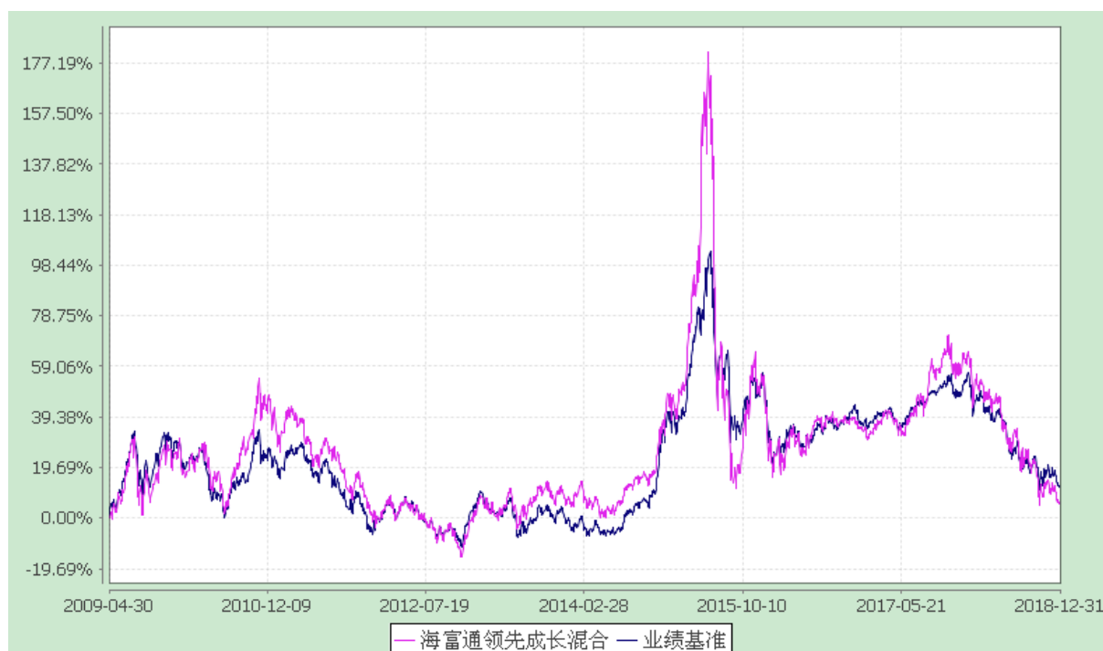
海富通领先成长混合型证券投资基金 份额累计净值增长率与业绩比较基准收益率的历史走势对比图 (2009 年 4 月 30 日至 2018 年 12 月 31 日)

注：按照基金合同规定，本基金建仓期为基金合同生效之日起六个月，即 2009 年 4 月 30 日至 2009 年 10 月 29 日。建仓期结束时本基金投资组合均达到本基金合同第十二条（二）、（七）规定的比例限制及本基金投资组合的比例范围。