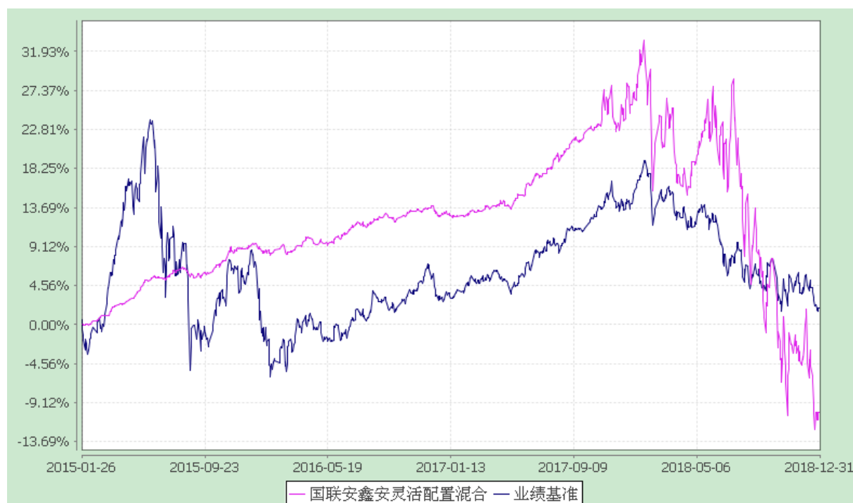
国联安鑫安灵活配置混合型证券投资基金 份额累计净值增长率与业绩比较基准收益率的历史走势对比图 (2015 年 1 月 26 日至 2018 年 12 月 31 日)

注：1、本基金业绩比较基准为：沪深 300 指数×50%+上证国债指数×50%；