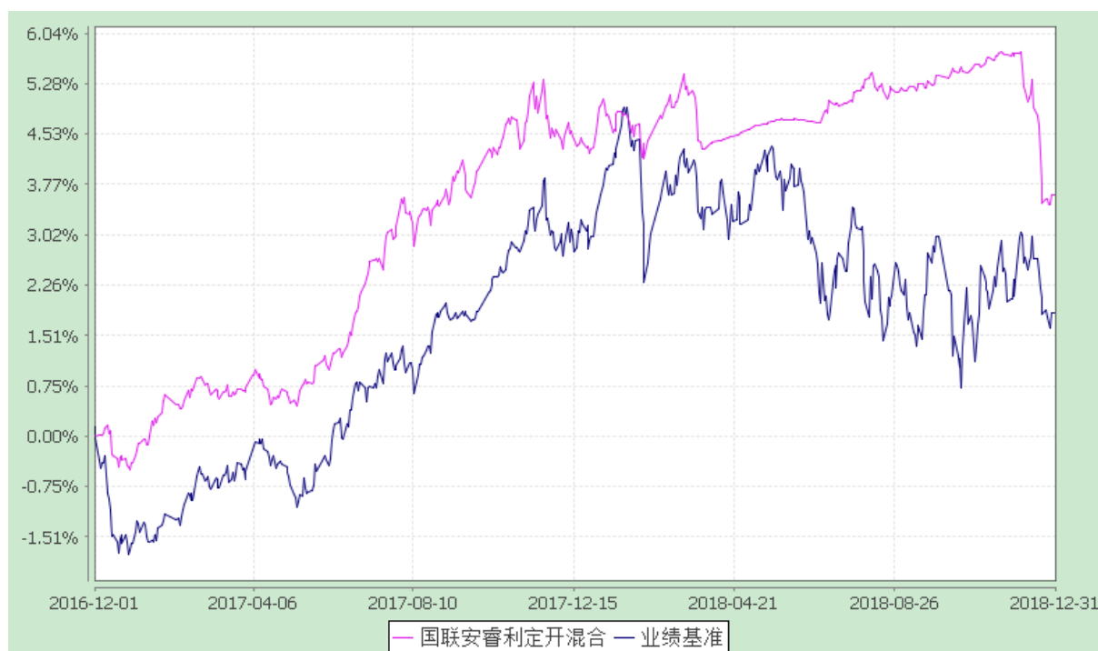
国联安睿利定期开放混合型证券投资基金 份额累计净值增长率与业绩比较基准收益率的历史走势对比图 (2016 年 12 月 1 日至 2018 年 12 月 31 日)

注：1、本基金业绩比较基准为：沪深 300 指数收益率×20%+上证国债指数收益率×80%； 2、本基金基金合同于 2016 年 12 月 1 日生效。本基金建仓期为自基金合同生效之日起的 6 个月，建仓期结束时各项资产配置符合合同约定； 3、上述基金业绩指标不包括持有人认购或交易基金的各项费用，计入费用后实际收益水平要低于所列数字。