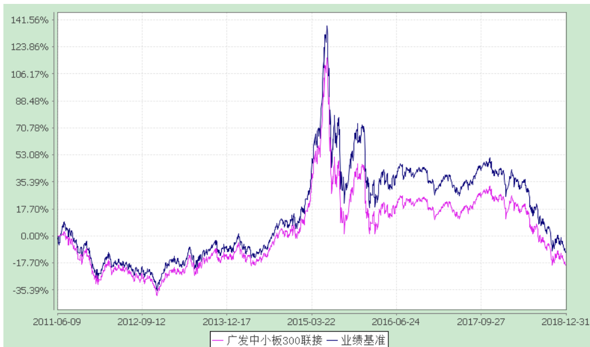
份额累计净值增长率与业绩比较基准收益率的历史走势对比图 (2011 年 6 月 9 日至 2018 年 12 月 31 日)