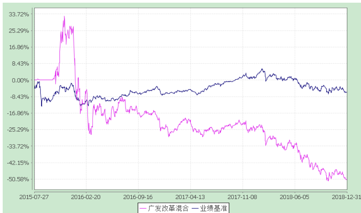
广发改革先锋灵活配置混合型证券投资基金 份额累计净值增长率与业绩比较基准收益率的历史走势对比图 (2015 年 7 月 27 日至 2018 年 12 月 31 日)