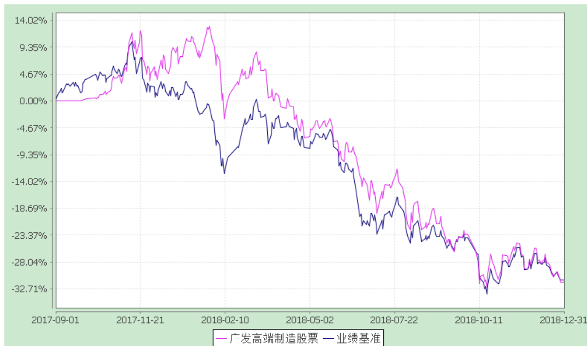
广发高端制造股票型发起式证券投资基金 份额累计净值增长率与业绩比较基准收益率的历史走势对比图 (2017 年 9 月 1 日至 2018 年 12 月 31 日)

注：本基金建仓期为基金合同生效后 6 个月，建仓期结束时各项资产配置比例符合本基金合同有关规定。