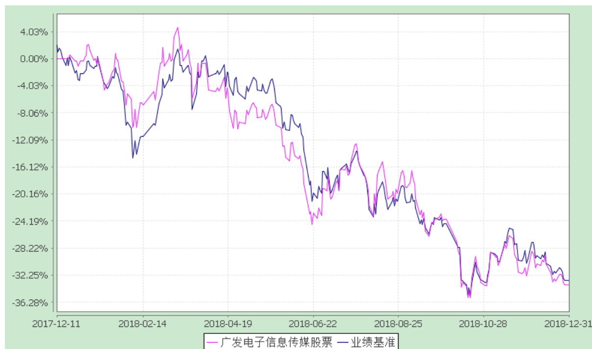
广发电子信息传媒产业精选股票型发起式证券投资基金 份额累计净值增长率与业绩比较基准收益率的历史走势对比图 (2017 年 12 月 11 日至 2018 年 12 月 31 日)