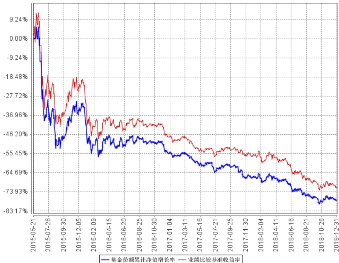
基金份额累计净值增长率与同期业绩比较基准收益率的历史走势对比图