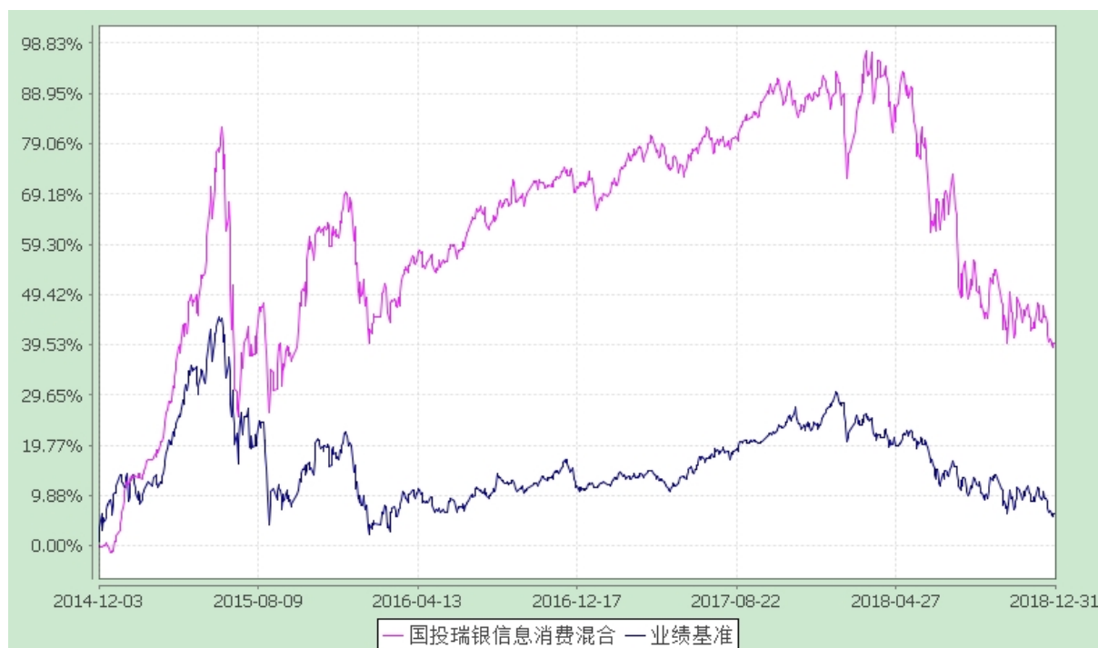
国投瑞银信息消费灵活配置混合型证券投资基金 份额累计净值增长率与业绩比较基准收益率的历史走势对比图 (2014 年 12 月 3 日至 2018 年 12 月 31 日)