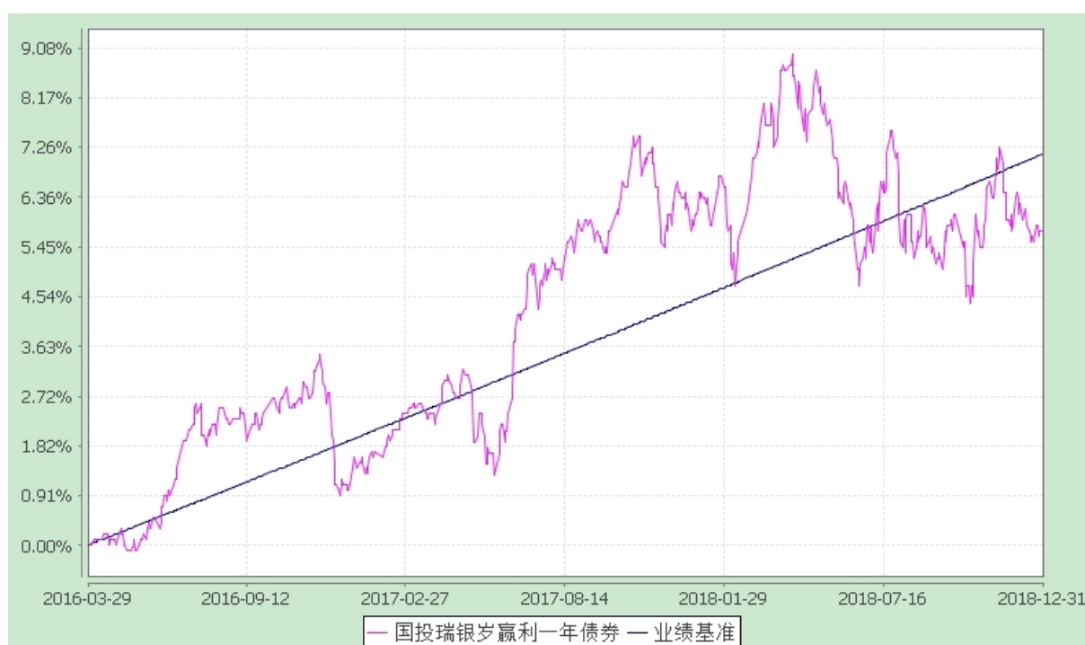
国投瑞银岁赢利一年期定期开放债券型证券投资基金 份额累计净值增长率与业绩比较基准收益率的历史走势对比图 (2016 年 3 月 29 日至 2018 年 12 月 31 日)

注：本基金建仓期为自基金合同生效日起的六个月。截至建仓期结束，本基金各项资产配置比例符合基金合同及招募说明书有关投资比例的约定。