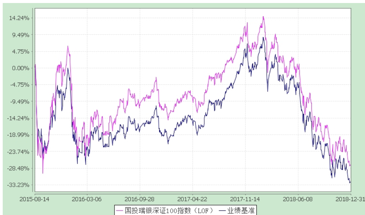
国投瑞银瑞福深证 100 指数证券投资基金 (LOF) 份额累计净值增长率与业绩比较基准收益率的历史走势对比图 (2015 年 8 月 14 日至 2018 年 12 月 31 日)

注：截至本报告期末各项资产配置比例分别为股票投资占基金净值比例 91.96%，权证投资占基金净值比例 0%，债券投资占基金净值比例 0%，现金和到期日不超过 1 年的政府债券占基金净值比例 8.26%，符合基金合同的相关规定。