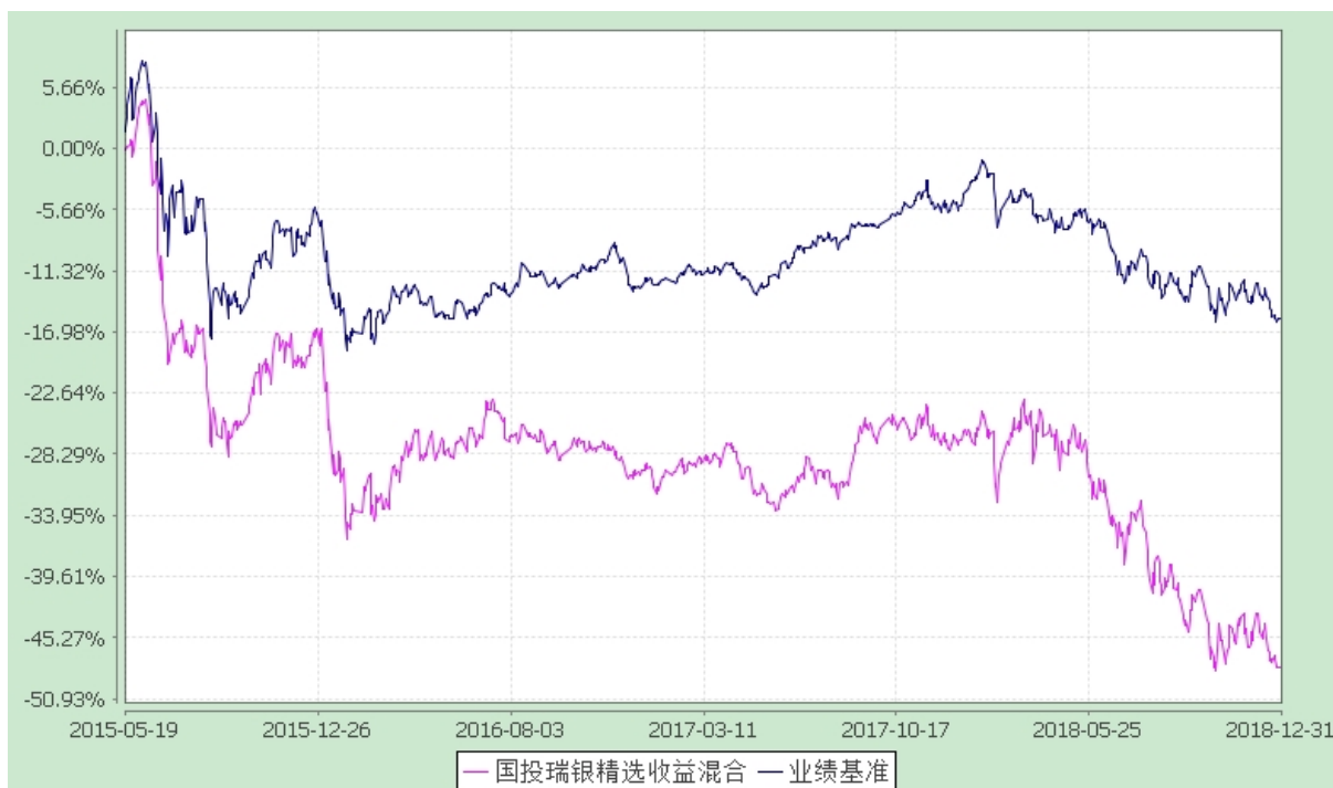
国投瑞银精选收益灵活配置混合型证券投资基金 份额累计净值增长率与业绩比较基准收益率的历史走势对比图 (2015 年 5 月 19 日至 2018 年 12 月 31 日)

注：本基金建仓期为自基金合同生效日起的 6 个月。截至建仓期结束，本基金各项资产配置比例符合基金合同及招募说明书有关投资比例的约定。