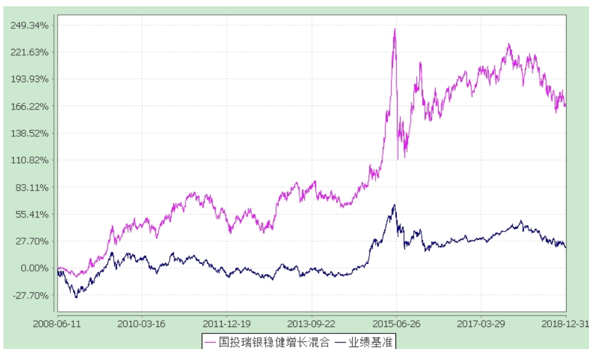
国投瑞银稳健增长灵活配置混合型证券投资基金 份额累计净值增长率与业绩比较基准收益率的历史走势对比图 (2008 年 6 月 11 日至 2018 年 12 月 31 日)

注：本基金建仓期为自基金合同生效日起的六个月。截至建仓期结束，本基金各项资产配置比例符合基金合同及招募说明书有关投资比例的约定。