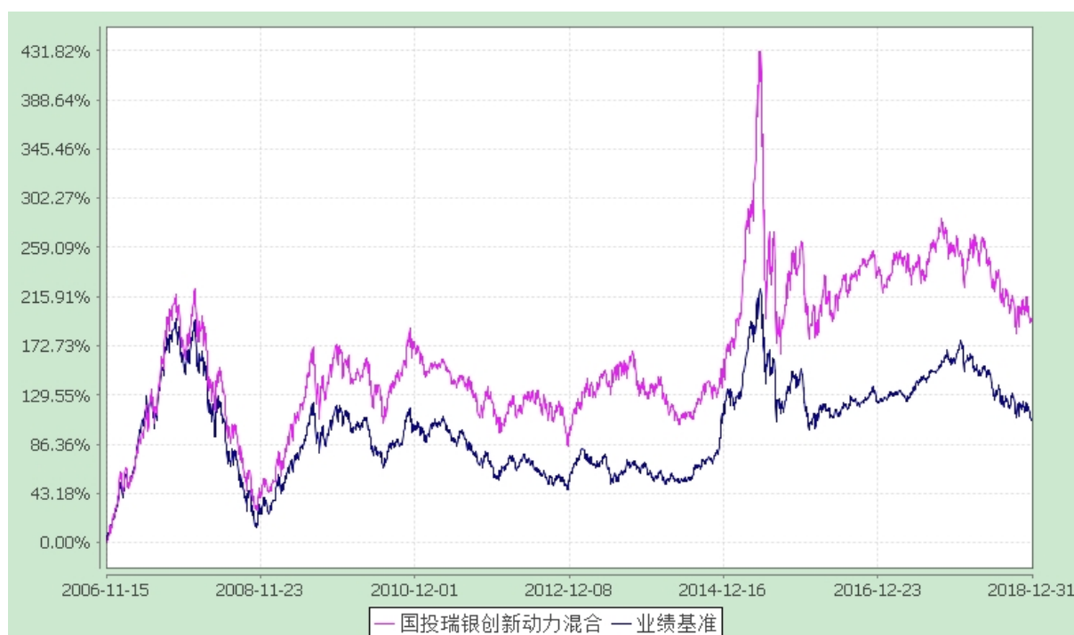
国投瑞银创新动力混合型证券投资基金 份额累计净值增长率与业绩比较基准收益率的历史走势对比图 (2006 年 11 月 15 日至 2018 年 12 月 31 日)

注：本基金建仓期为自基金合同生效日起的六个月。截至建仓期结束，本基金各项资产配置比例符合基金合同及招募说明书有关投资比例的约定。