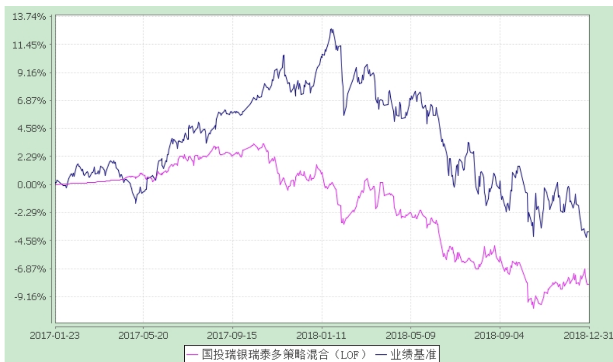
国投瑞银瑞泰多策略灵活配置混合型证券投资基金（LOF） 份额累计净值增长率与业绩比较基准收益率的历史走势对比图 (2017 年 1 月 23 日至 2018 年 12 月 31 日)

注：本基金建仓期为自基金合同生效日起的六个月。截至建仓期结束，本基金各项资产配置比例符合基金合同及招募说明书有关投资比例的约定。