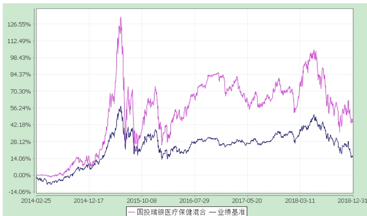
国投瑞银医疗保健行业灵活配置混合型证券投资基金 份额累计净值增长率与业绩比较基准收益率的历史走势对比图 (2014 年 2 月 25 日至 2018 年 12 月 31 日)