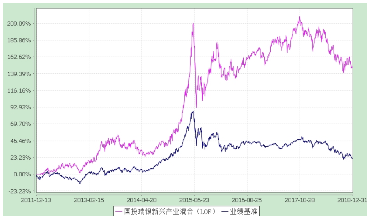
国投瑞银新兴产业混合型证券投资基金(LOF) 份额累计净值增长率与业绩比较基准收益率的历史走势对比图 (2011 年 12 月 13 日至 2018 年 12 月 31 日)

注：本基金建仓期为自基金合同生效日起的 6 个月。截至建仓期结束，本基金各项资产配置比例符合基金合同及招募说明书有关投资比例的约定。