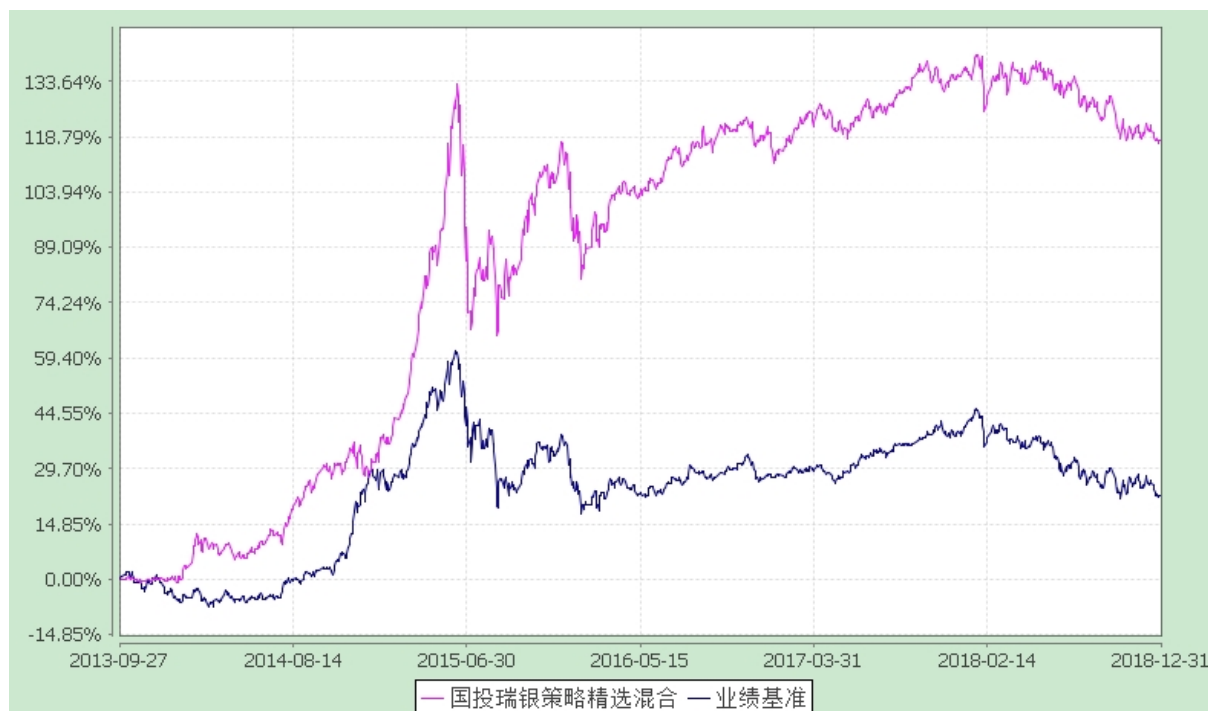
国投瑞银策略精选灵活配置混合型证券投资基金 份额累计净值增长率与业绩比较基准收益率的历史走势对比图 (2013 年 9 月 27 日至 2018 年 12 月 31 日)