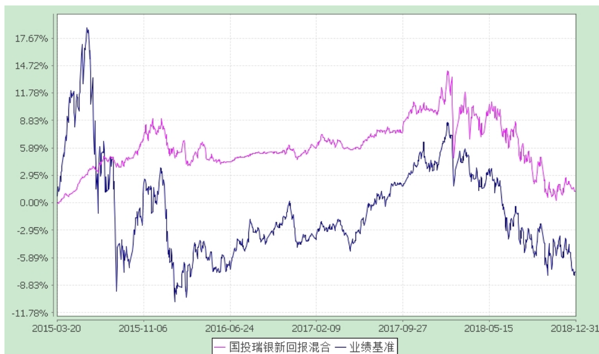
国投瑞银新回报灵活配置混合型证券投资基金 份额累计净值增长率与业绩比较基准收益率的历史走势对比图 (2015 年 3 月 20 日至 2018 年 12 月 31 日)

注：本基金建仓期为自基金合同生效日起的六个月。截至建仓期结束，本基金各项资产配置比例符合基金合同及招募说明书有关投资比例的约定。