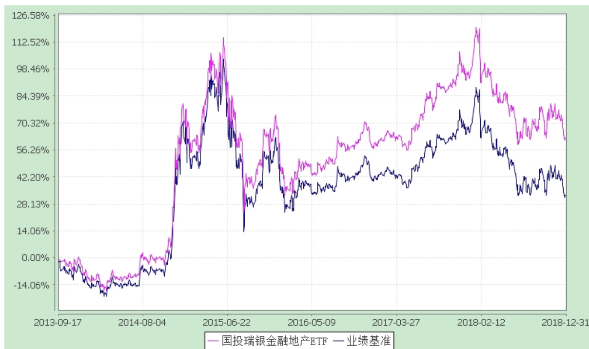
国投瑞银沪深 300 金融地产交易型开放式指数证券投资基金 份额累计净值增长率与业绩比较基准收益率的历史走势对比图 (2013 年 9 月 17 日至 2018 年 12 月 31 日)

注：本基金建仓期为自基金合同生效日起的 3 个月。截至建仓期结束，本基金各项资产配置比例符合基金合同及招募说明书有关投资比例的约定。