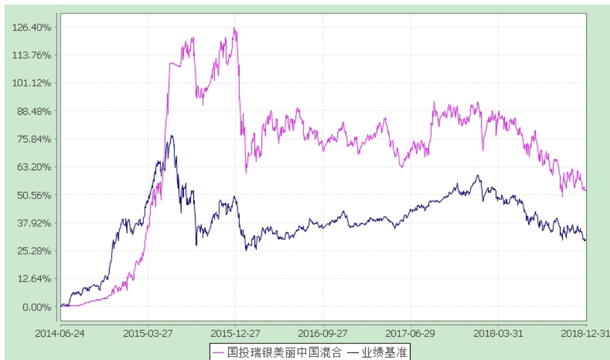
国投瑞银美丽中国灵活配置混合型证券投资基金 份额累计净值增长率与业绩比较基准收益率的历史走势对比图 (2014 年 6 月 24 日至 2018 年 12 月 31 日)