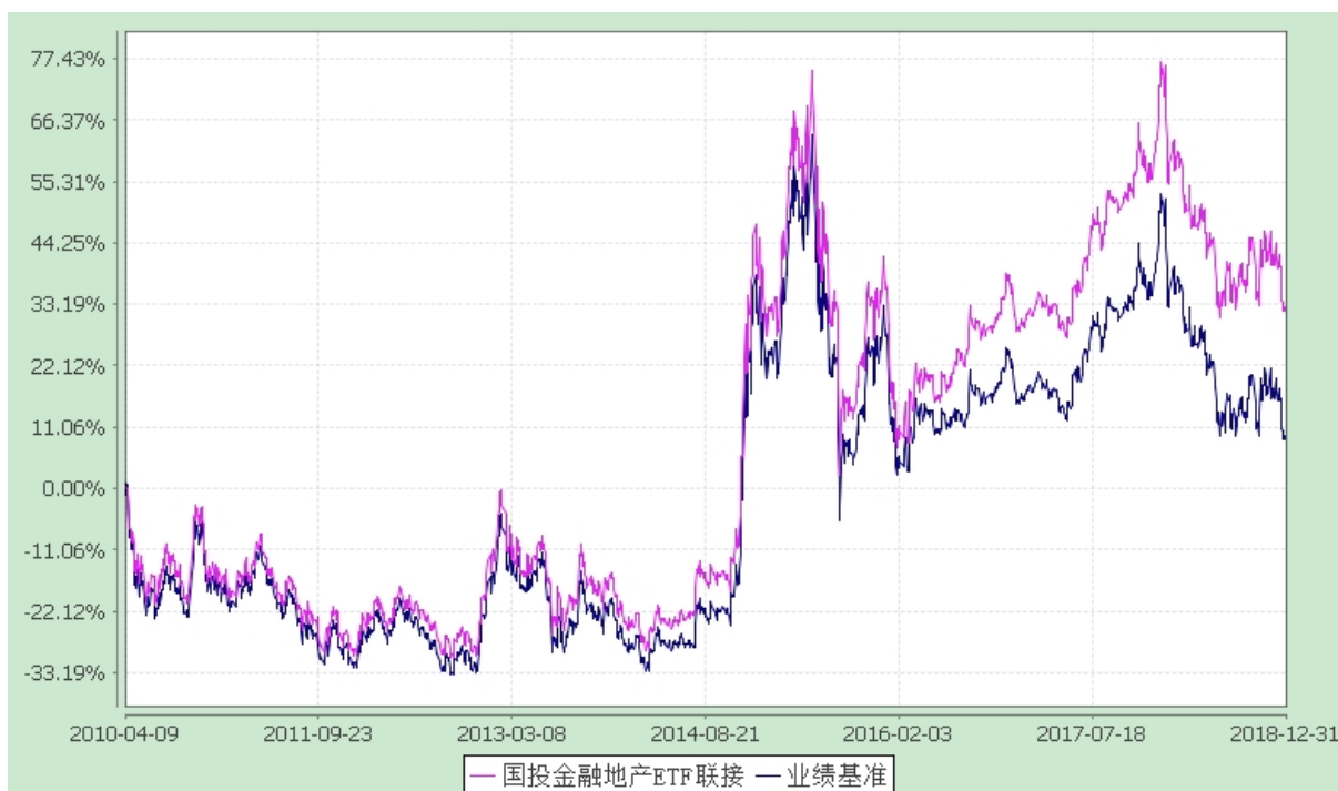
国投瑞银沪深 300 金融地产交易型开放式指数证券投资基金联接基金 份额累计净值增长率与业绩比较基准收益率的历史走势对比图 (2010 年 4 月 9 日至 2018 年 12 月 31 日)

注：2013 年 11 月 5 日起国投瑞银沪深 300 金融地产指数证券投资基金（LOF）转型变更为国投瑞银沪深 300 金融地产交易型开放式指数证券投资基金联接基金（简称“本基金”）。《国投瑞银沪深 300 金融地产交易型开放式指数证券投资基金联接基金基金合同》于 2013 年 11 月 5 日起生效。本基金建仓期为自基金合同生效日起的 3 个月。截至建仓期结束，本基金各项资产配置比例符合基金合同及招募说明书有关投资比例的约定。