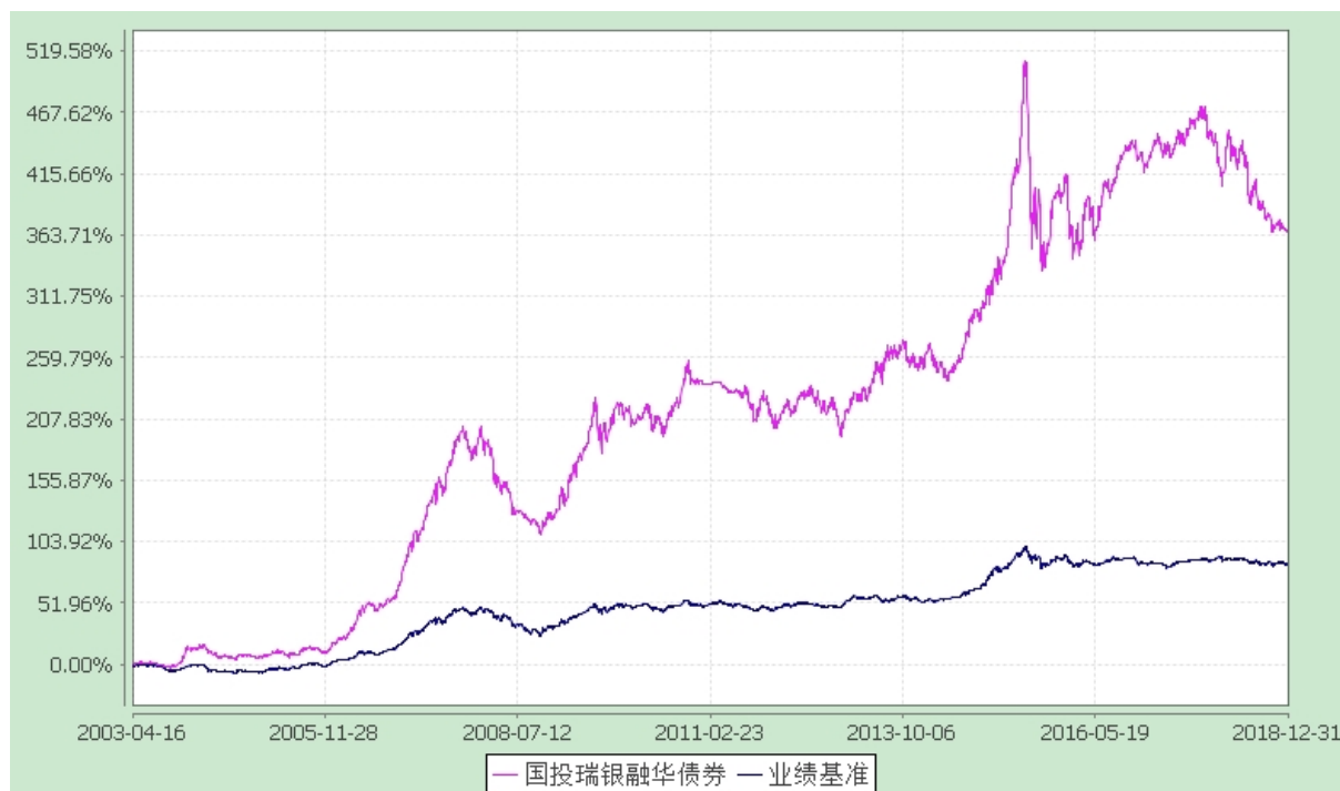
国投瑞银融华债券型证券投资基金 份额累计净值增长率与业绩比较基准收益率的历史走势对比图 (2003 年 4 月 16 日至 2018 年 12 月 31 日)