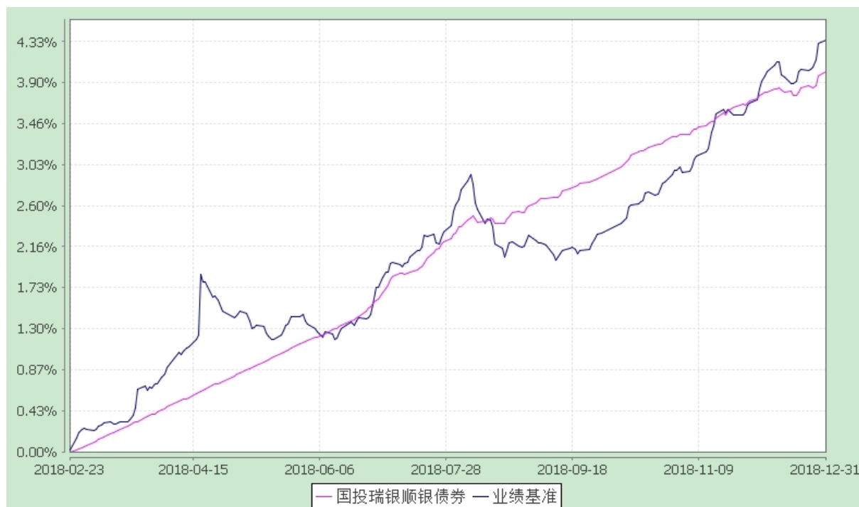
国投瑞银顺银 6 个月定期开放债券型发起式证券投资基金 份额累计净值增长率与业绩比较基准收益率的历史走势对比图 (2018 年 2 月 23 日至 2018 年 12 月 31 日)

注：1、本基金建仓期为自基金合同生效日起的 6 个月。截至建仓期结束，本基金各项资产配置比例复核基金合同以及招募说明书有关投资比例的规定。