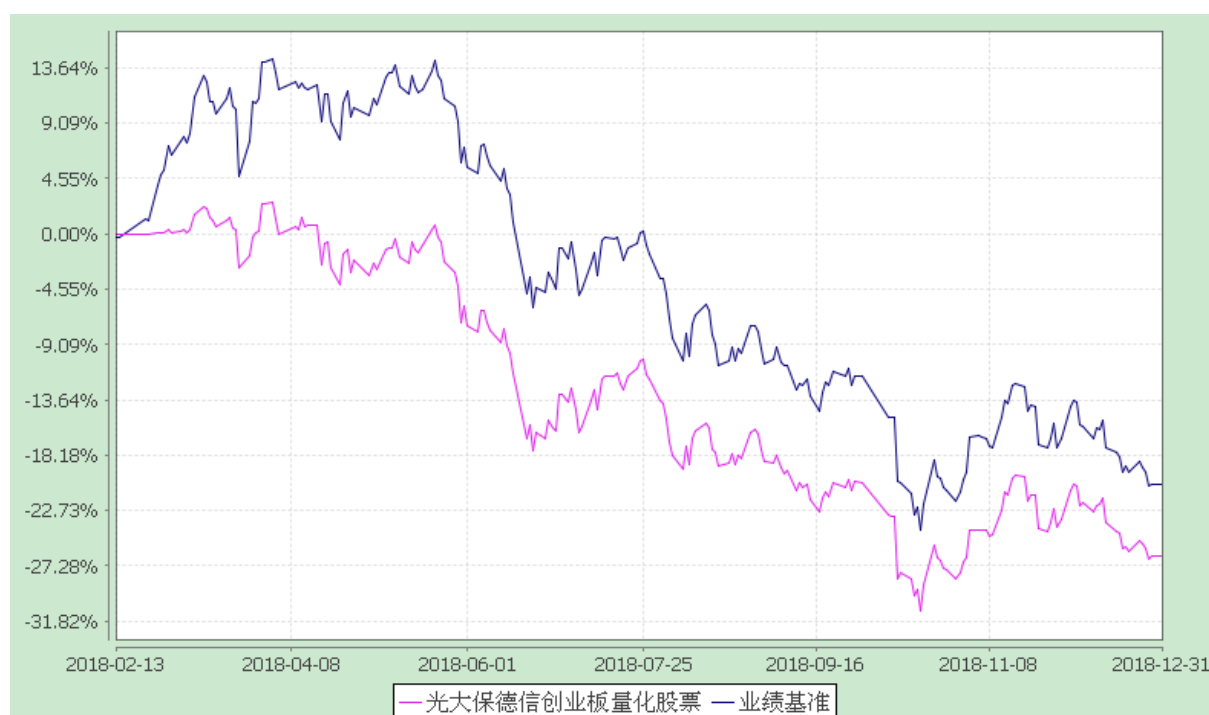
光大保德信创业板量化优选股票型证券投资基金 份额累计净值增长率与业绩比较基准收益率的历史走势对比图 (2018年2月13日至2018年12月31日)

注：根据基金合同的规定，本基金建仓期为2018年2月13日至2018年8月12日。建仓期结束时本基金各项资产配置比例符合本基金合同规定的比例限制及投资组合的比例范围。