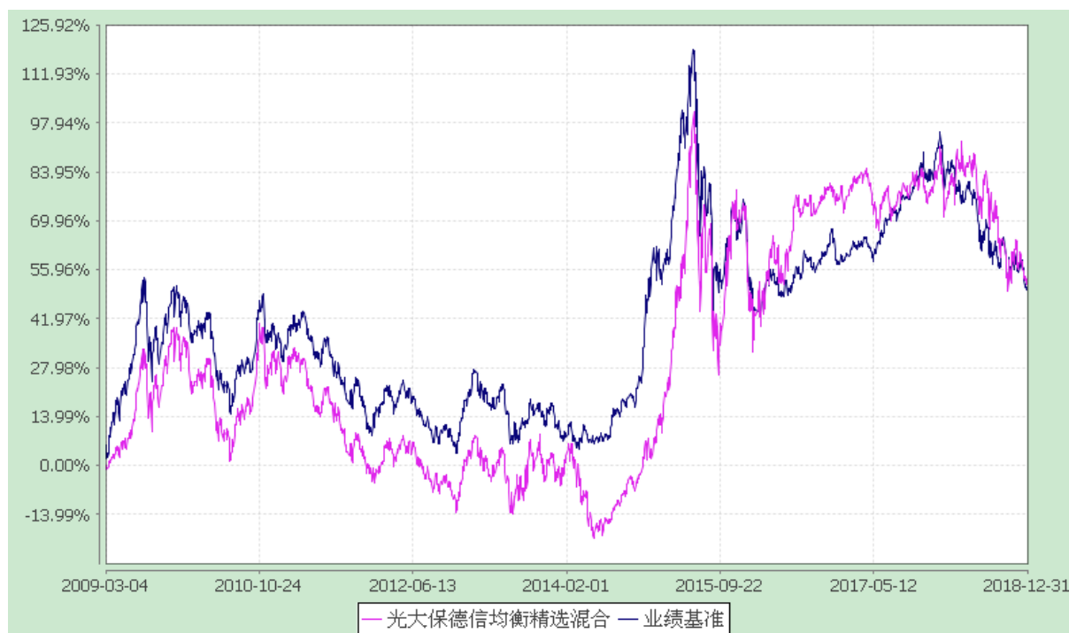
光大保德信均衡精选混合型证券投资基金 份额累计净值增长率与业绩比较基准收益率的历史走势对比图 (2009 年 3 月 4 日至 2018 年 12 月 31 日)

注：根据基金合同的规定，本基金建仓期为 2009 年 3 月 4 日至 2009 年 9 月 3 日。建仓期结束时本基金各项资产配置比例符合本基金合同规定的比例限制及投资组合的比例范围。