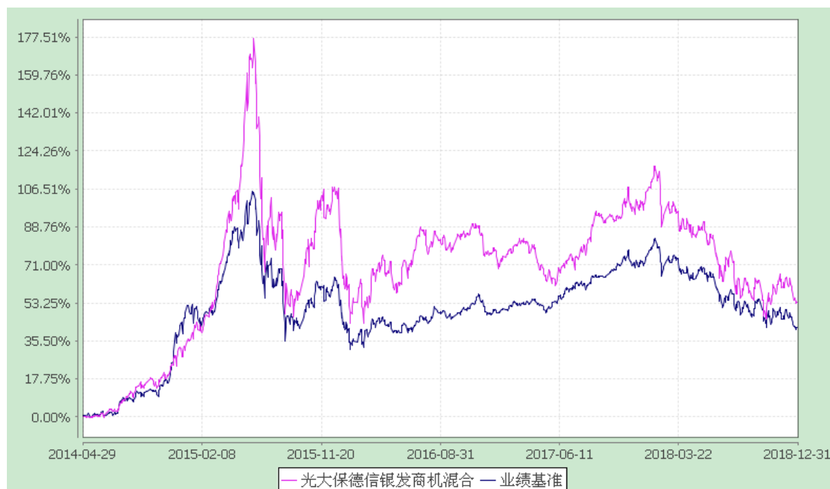
光大保德信银发商机主题混合型证券投资基金 份额累计净值增长率与业绩比较基准收益率的历史走势对比图 (2014 年 4 月 29 日至 2018 年 12 月 31 日)