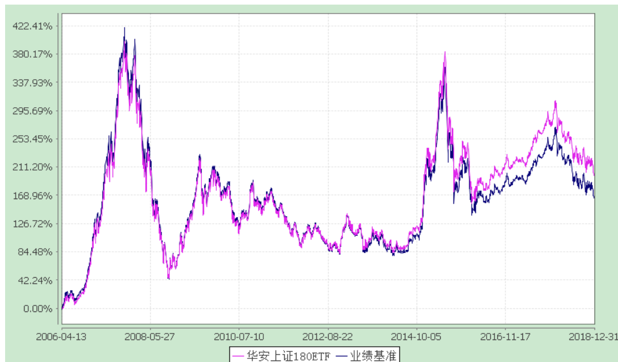
上证 180 交易型开放式指数证券投资基金 份额累计净值增长率与业绩比较基准收益率的历史走势对比图 (2006 年 4 月 13 日至 2018 年 12 月 31 日)