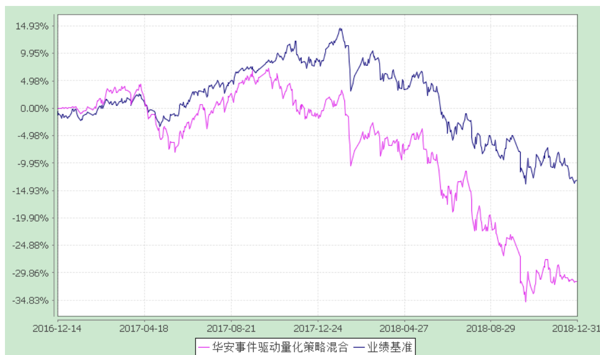
华安事件驱动量化策略混合型证券投资基金 份额累计净值增长率与业绩比较基准收益率的历史走势对比图 (2016 年 12 月 14 日至 2018 年 12 月 31 日)