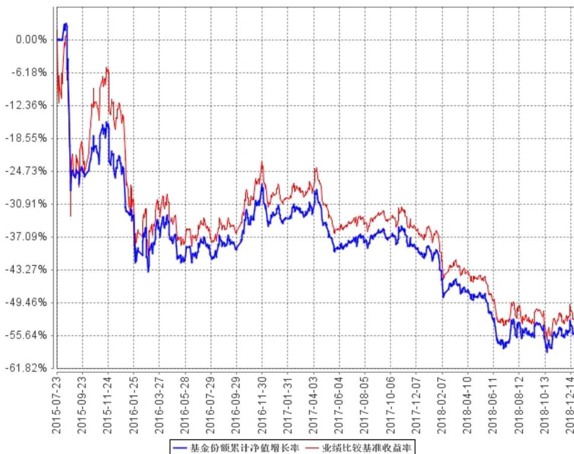
基金份额累计净值增长率与同期业绩比较基准收益率的历史走势对比图