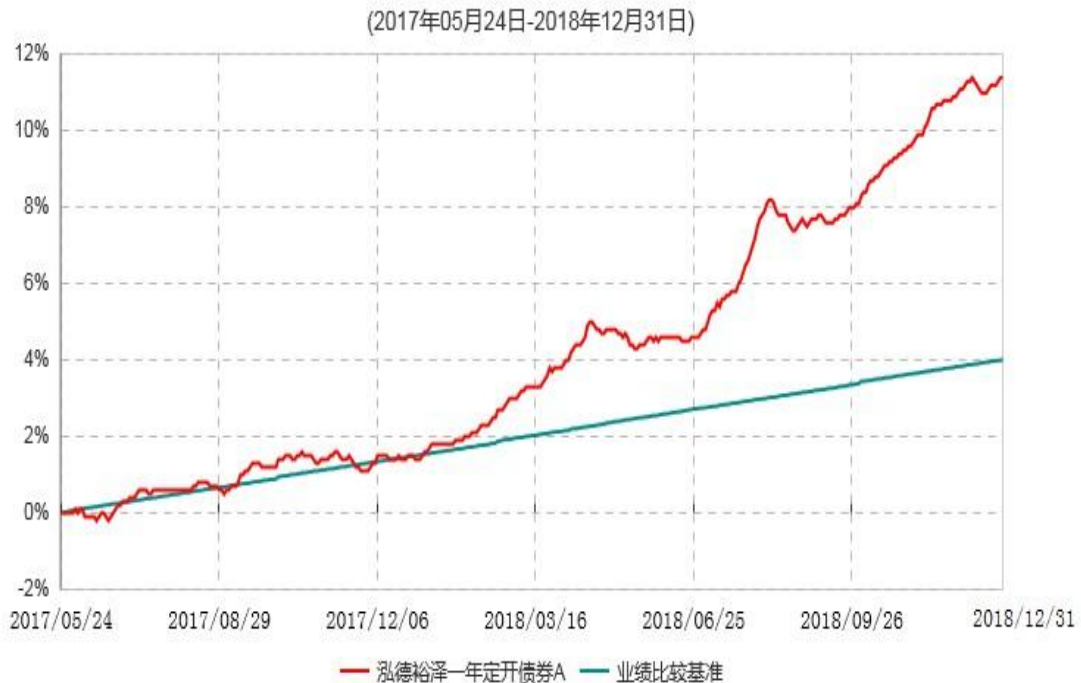
泓德裕泽一年定开债券A累计净值增长率与业绩比较基准收益率历史走势对比图