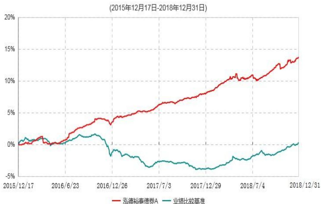
泓德裕泰债券A累计净值增长率与业绩比较基准收益率历史走势对比图