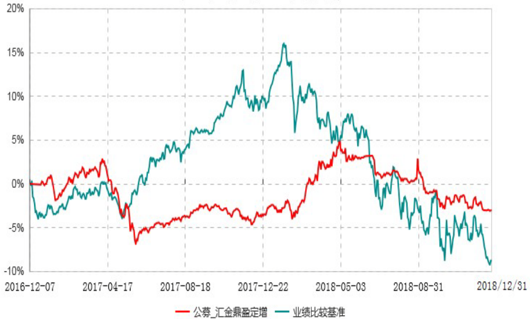
浙商汇金鼎盈事件驱动灵活配置混合型证券投资基金累计净值增长率与业绩比较基准收益率历史走势对比图 (2016年12月07日-2018年12月31日)