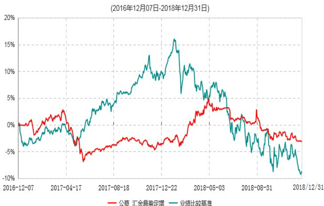
浙商汇金鼎盈事件驱动灵活配置混合型证券投资基金累计净值增长率与业绩比较基准收益率历史走势对比图