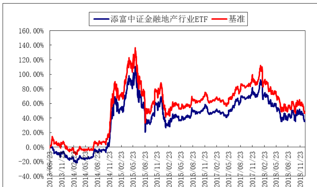
(二)自基金合同生效以来基金累计净值增长率变动及其与同期业绩比较基准收益率变动的比较图