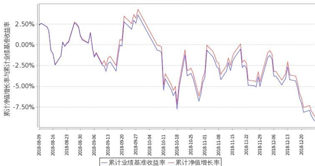
图 2：嘉实沪深 300ETF 联接 (LOF)C 基金份额累计净值增长率与同期业绩比较基准收益率的历史走势对比图