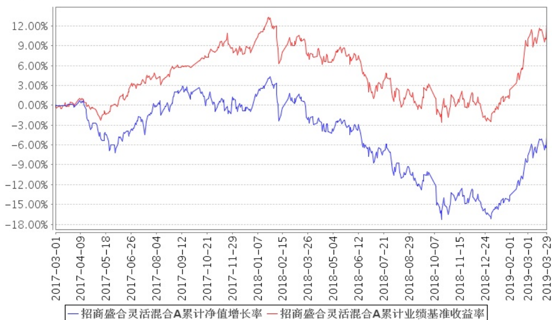
招商盛合灵活混合A累计净值增长率与同期业绩比较基准收益率的历史走势对比图