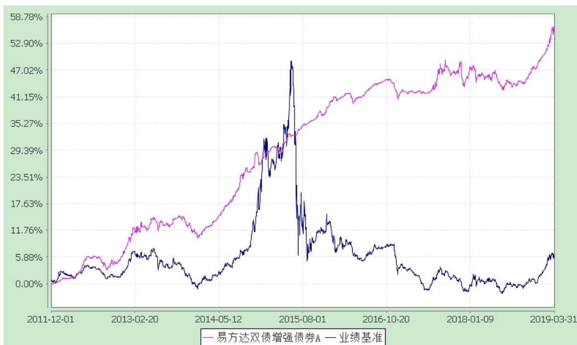
易方达双债增强债券 C