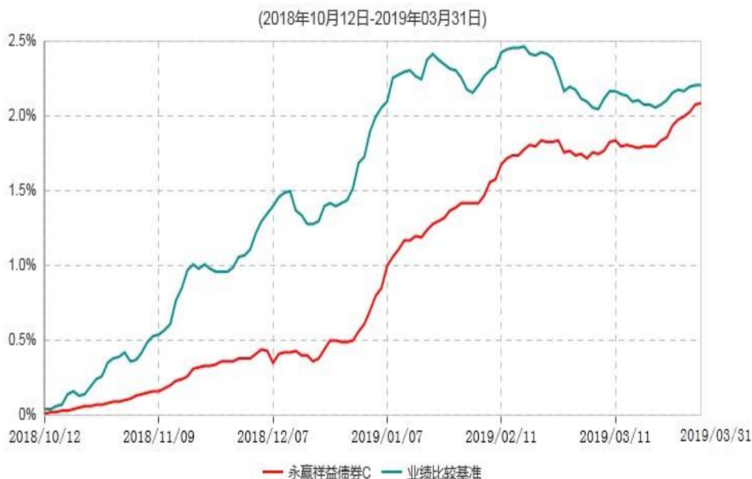
永赢祥益债券C累计净值增长率与业绩比较基准收益率历史走势对比图

注：1、本基金合同生效日为 2018 年 10 月 12 日，截至本报告期末基金合同生效未满 1 年。 2、本基金建仓期为本基金合同生效日起 6 个月，截至本报告期末，本基金尚处于建仓期。