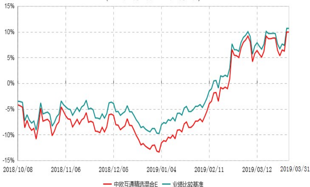
中欧互通精选混合E累计净值增长率与业绩比较基准收益率历史走势对比图 (2018年10月08日-2019年03月31日)

注：自 2018 年 10 月 8 日起，原中欧沪深 300 指数增强型证券投资基金名称变更为中欧互通精选混合型证券投资基金。截止报告期末，本基金转型后基金合同生效未满一年，本基金自基金合同转型生效起六个月为建仓期，建仓期结束时各项资产配置比例应当符合基金合同约定。图示为 2018 年 10 月 8 日至 2019 年 03 月 31 日。