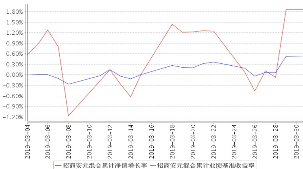
招商安元混合累计净值增长率与同期业绩比较基准收益率的历史走势对比图

注：本基金转型日期为2019年3月2日，截止报告期末，本基金转型后基金合同生效未满一年；自基金成立日起6个月内为建仓期，截至报告期末基金尚未完成建仓。