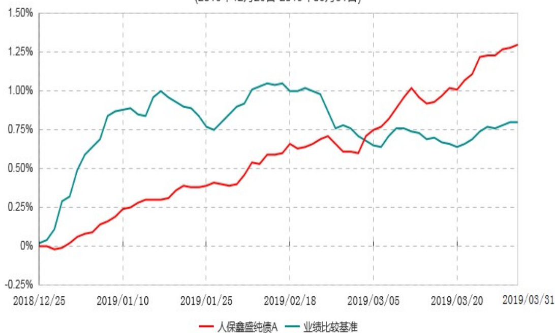
人保鑫盛纯债C累计净值增长率与业绩比较基准收益率历史走势对比图