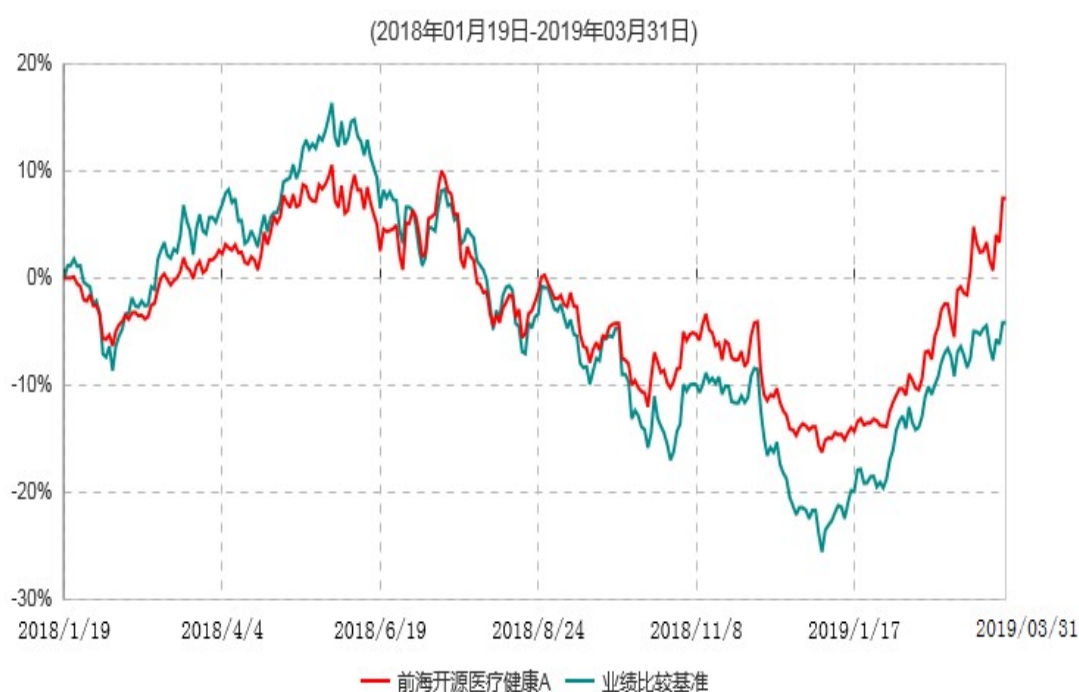
前海开源医疗健康A累计净值增长率与业绩比较基准收益率历史走势对比图