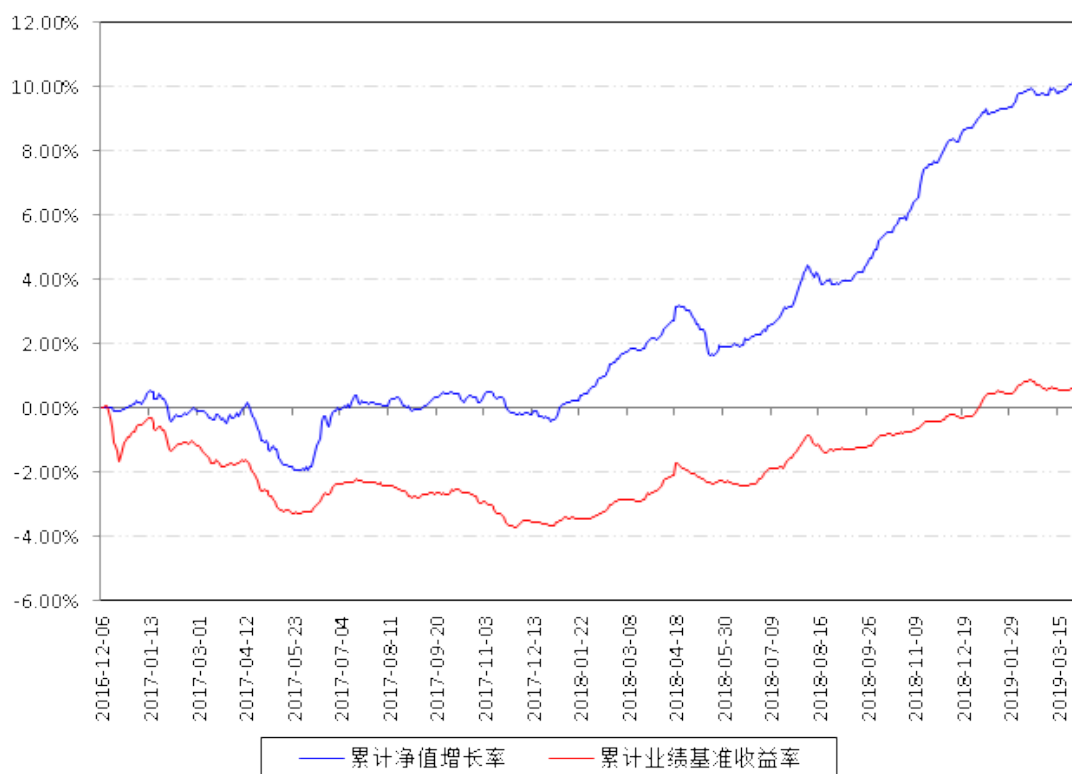
南方宣利A累计净值增长率与同期业绩比较基准收益率的历史走势对比图