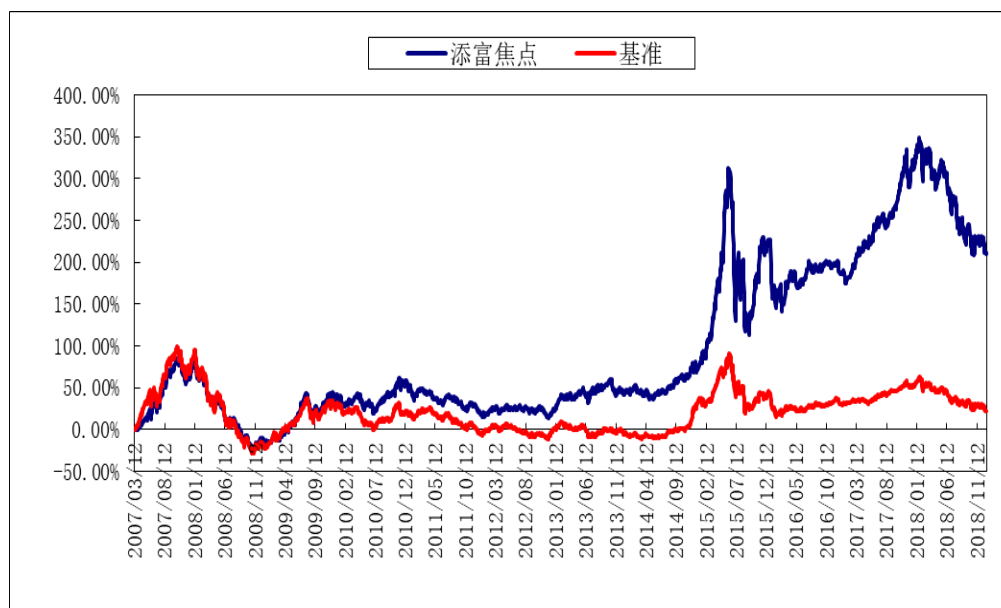
(二) 自基金合同生效以来基金累计净值增长率变动及其与同期业绩比较基准收益率变动的比较图