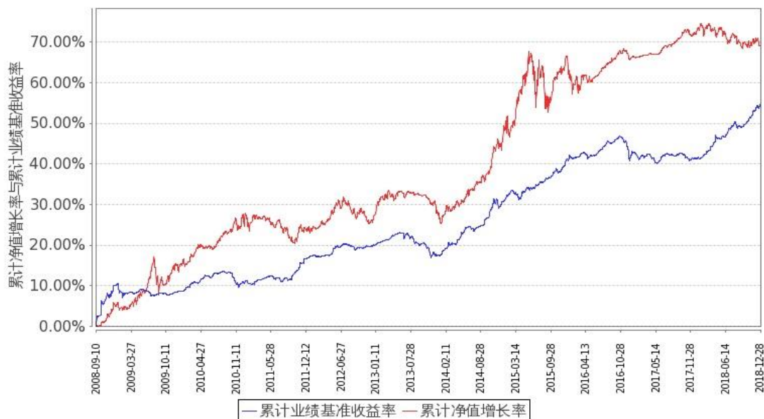
图 2: 嘉实多元债券 B 基金份额累计净值增长率与同期业绩比较基准收益率的历史走势对比