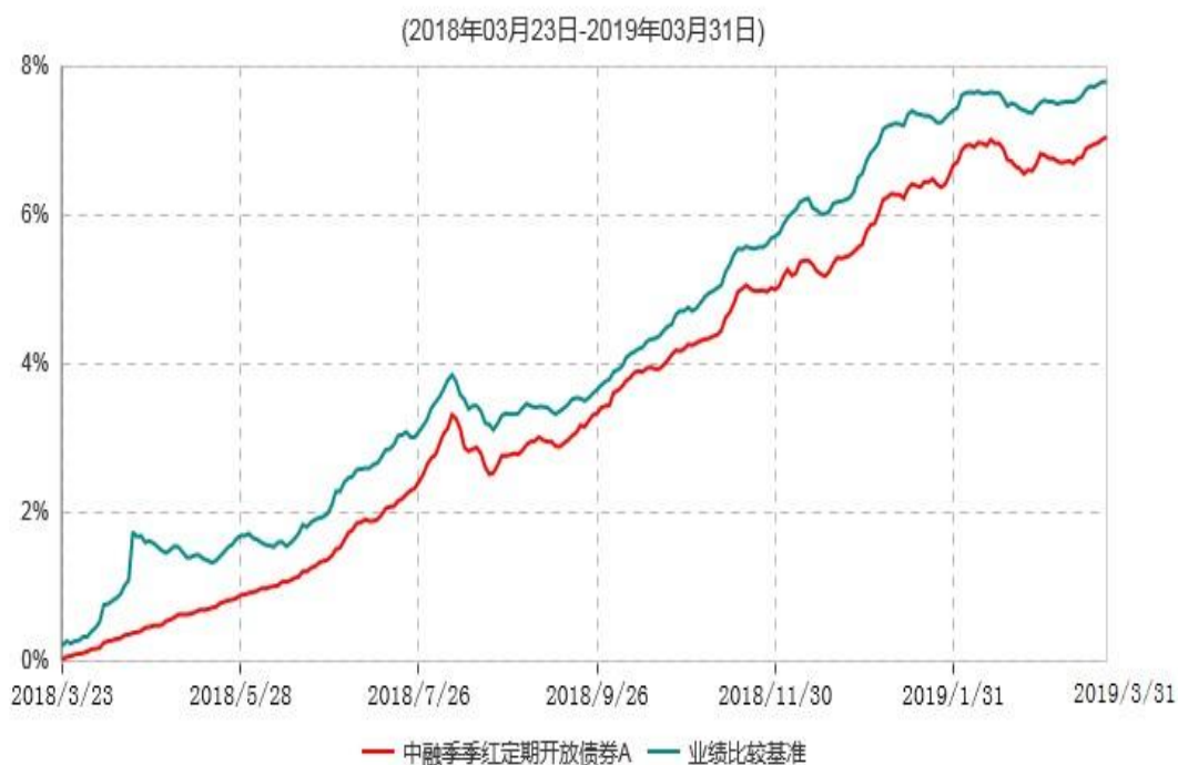
中融季季红定期开放债券A累计净值增长率与业绩比较基准收益率历史走势对比图